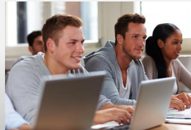
© Robert Kneschke – stock.adobe.com #35674409

WLAN Campus mit kostenfreiem Schüler WLAN