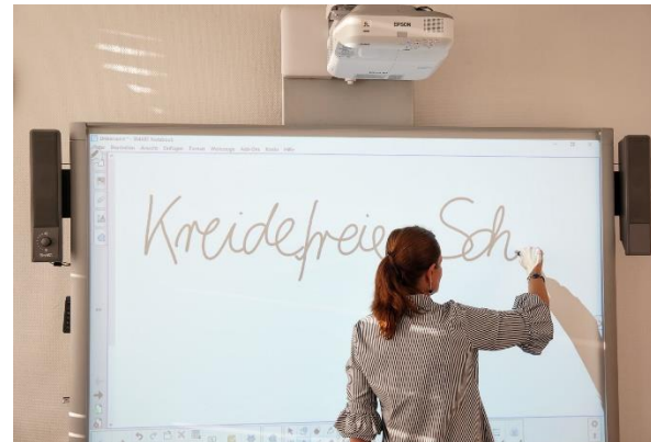
SmartBoards in allen Unterrichtsräumen

Mobiles Klassenzimmer (Notebookwagen mit 16 Notebooks)