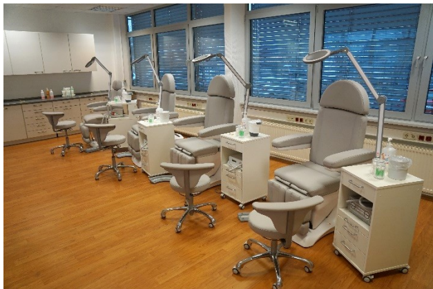
Praxisraum des IBB

...für Podologen ist der Start in die eigene Praxis nicht schwer, sowohl in der ambulanten als auch bei der stationären Behandlung.